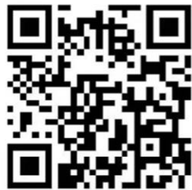
未就业高校毕业生求职登记 小程序二维码